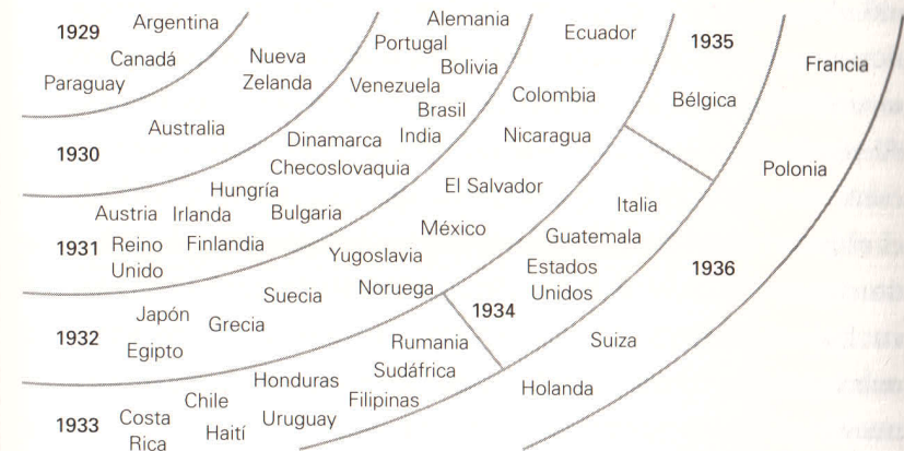
Diagrama 2.1. Fin del patrón oro de entreguerras

Nota: Entre paréntesis se indica el año de salida del patrón oro o, alternativamente, patrón cambio oro.